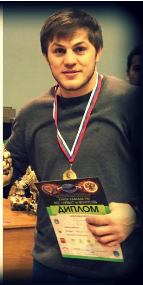
В 2014 г. возглавил МБУ ДО г. Махачкалы «Детско-юношескую спортивную школу Бузы Ибрагимова».